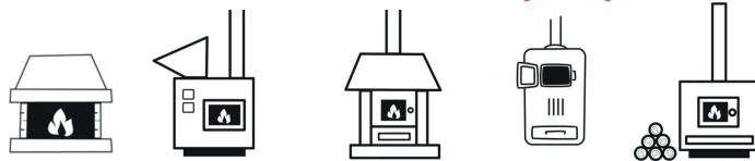
CAMINETTI APERTI, CAMINI CHIUSI, STUFE, INSERTI E CUCINE A LEGNA O PELLETT, CALDAIE ALIMENTATE A PELLETT O CIPPATO