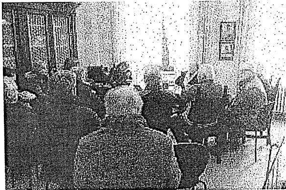
COMITATO Un momento dell'incontro di ieri mattina in municipio a Castelvetro

Le voci in paese parlavano di alcuni cambiamenti del progetto, ma sono state tutte smentite dal primo cittadino che però ha annunciato: «Stamattina [ieri n.d.r.] l'azienda Inalca ha depositato una richiesta presso i nostri uffici, che ancora non conosco. Quindi appena ne saprò di più, lo comunicherò pubblicamente. Per ora posso dire che